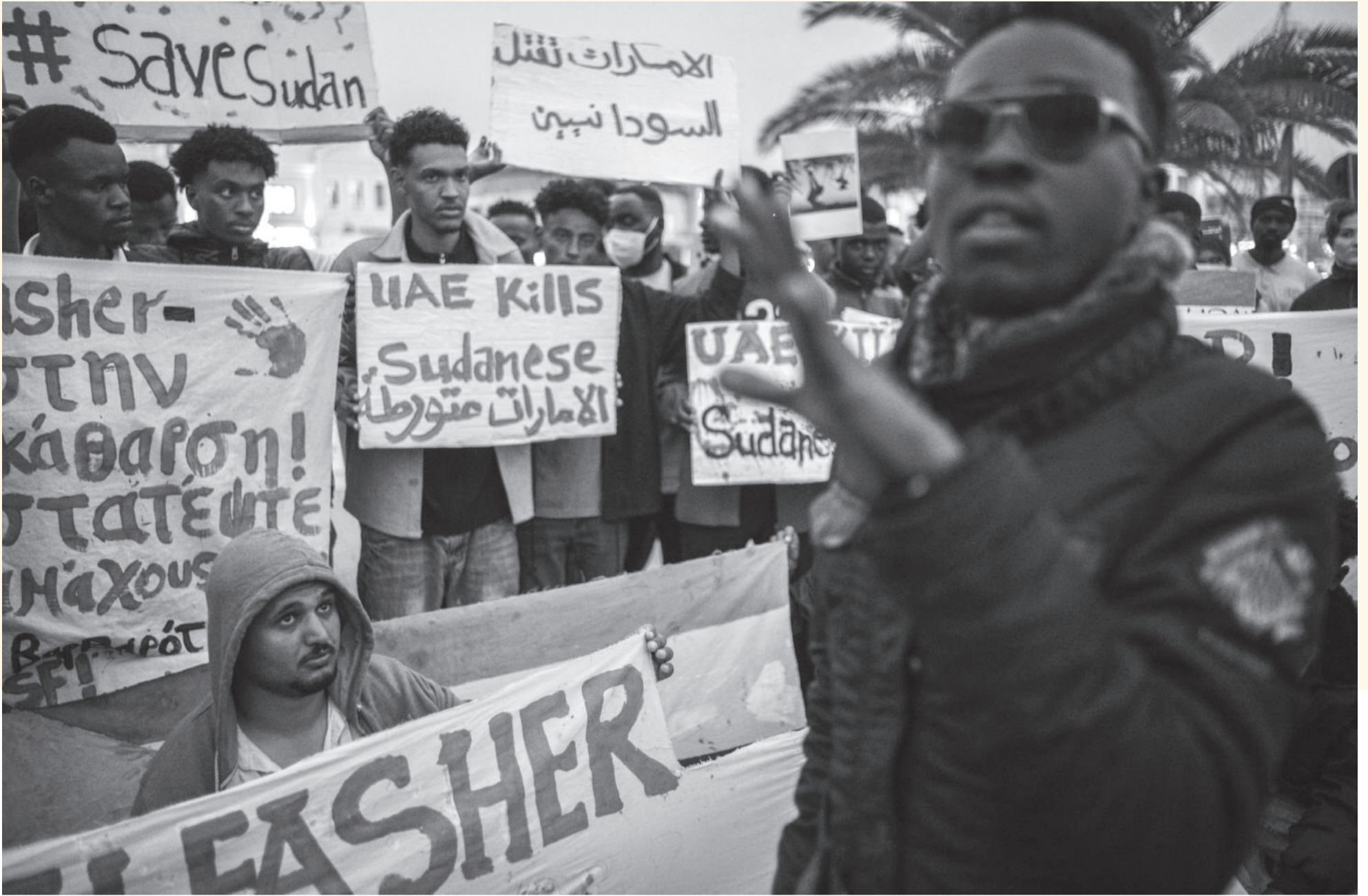
Kundgebung gegen die Kriegsverbrechen der paramilitärische Rapid Support Forces (RSF) im Sudan und ihre Verbündeten, die Vereinigten Arabischen Emirate. Mytilini, Lesbos 2025