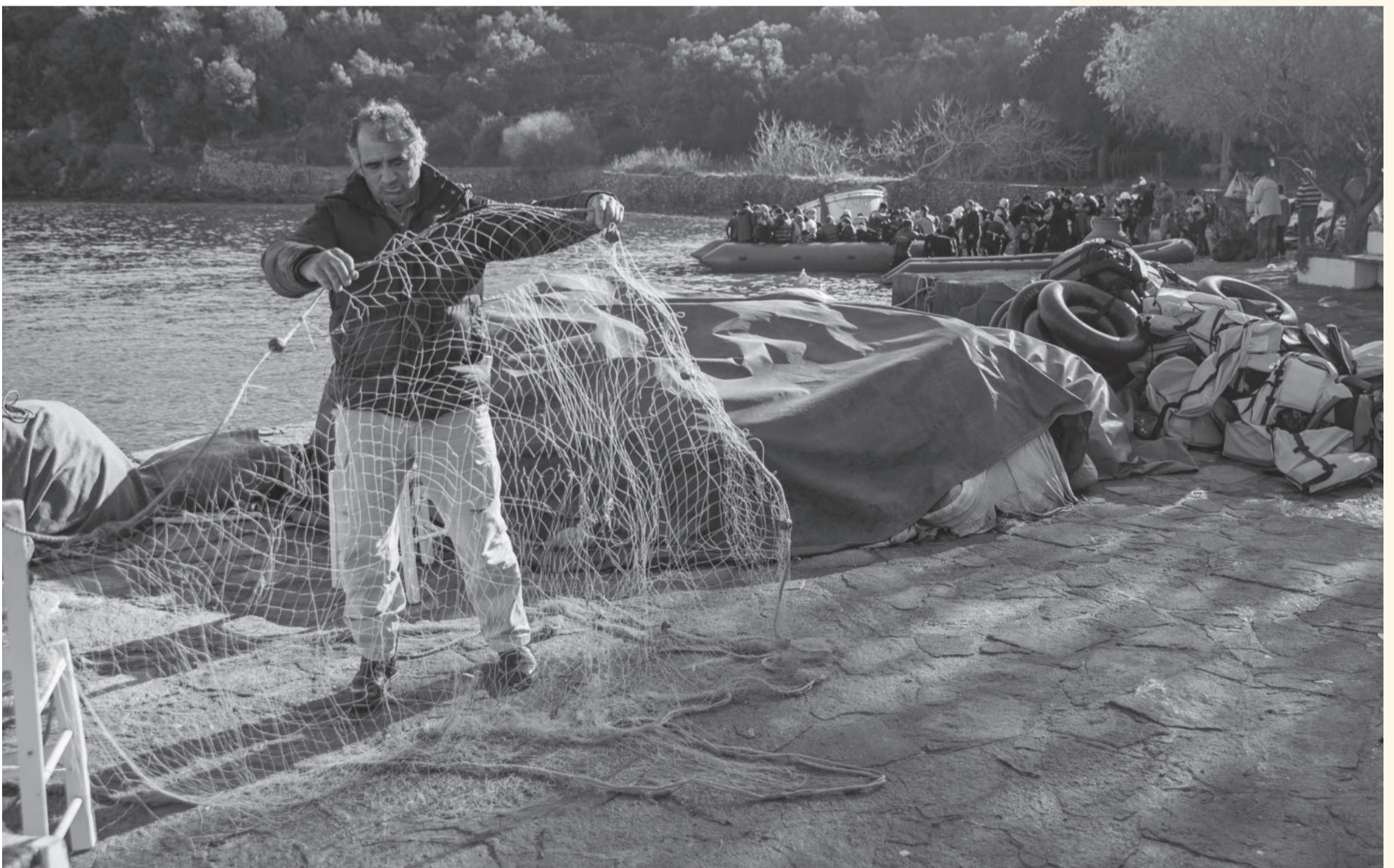
Sie fuhren zum Fischen hinaus und brachten Menschen nach Hause. 2015 haben die Fischer von Lesbos unzähligen Schutzsuchenden das Leben gerettet. Wieviele Menschen durch die brutalen Abschottungspolitik der EU seither ertrunken sind, weiss niemand.