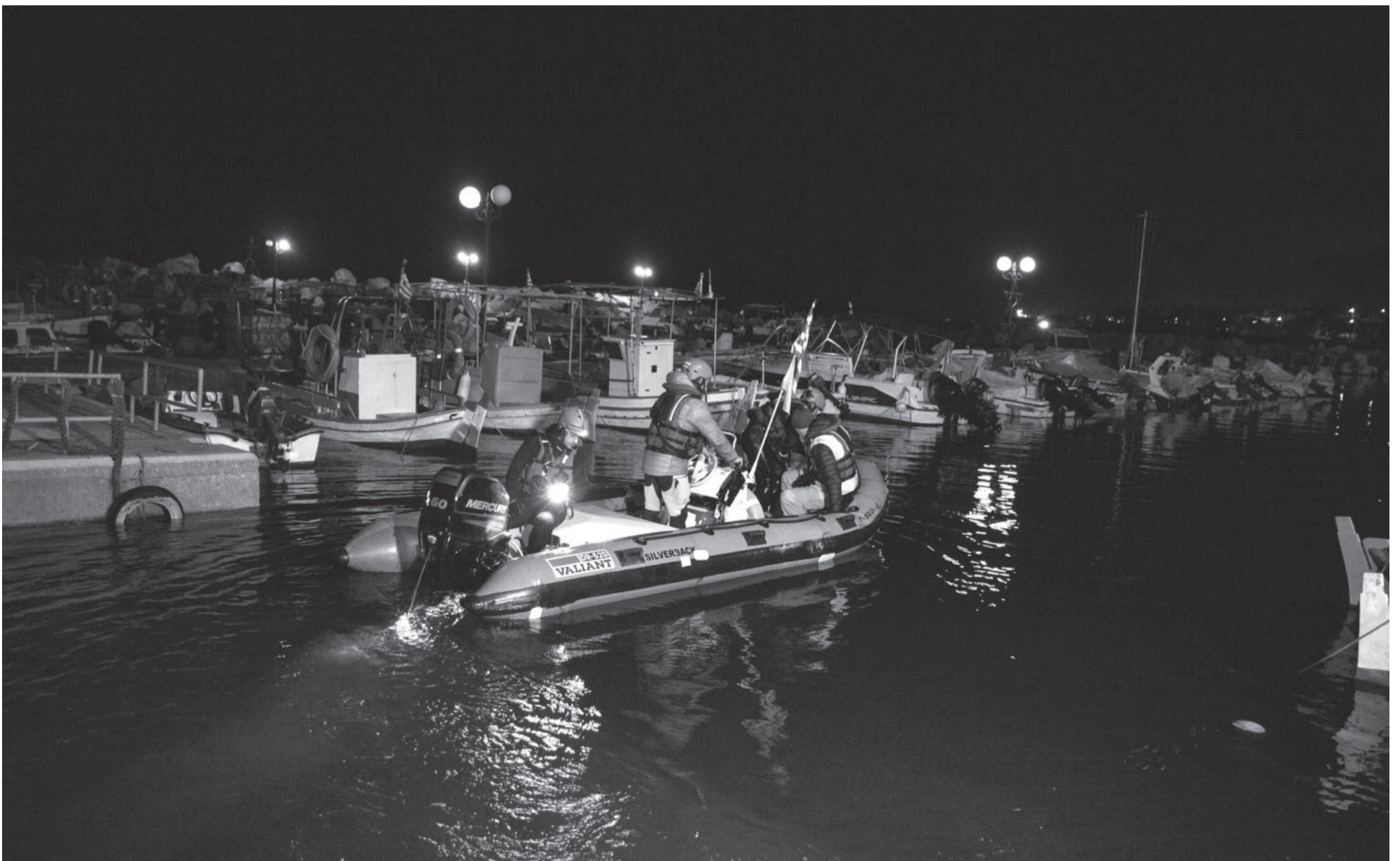
Einsatzkräfte arbeiteten 2015 in enger Korordination zur Rettung in Seemnot geratener Geflüchteter zusammen. Zehn Jahre später ist die Arbeit von NGOs auf dem Wasser de facto verboten, Frontex wurde systematisch hochgerüstet und die EU setzt auf Abschreckung und Abschottung.