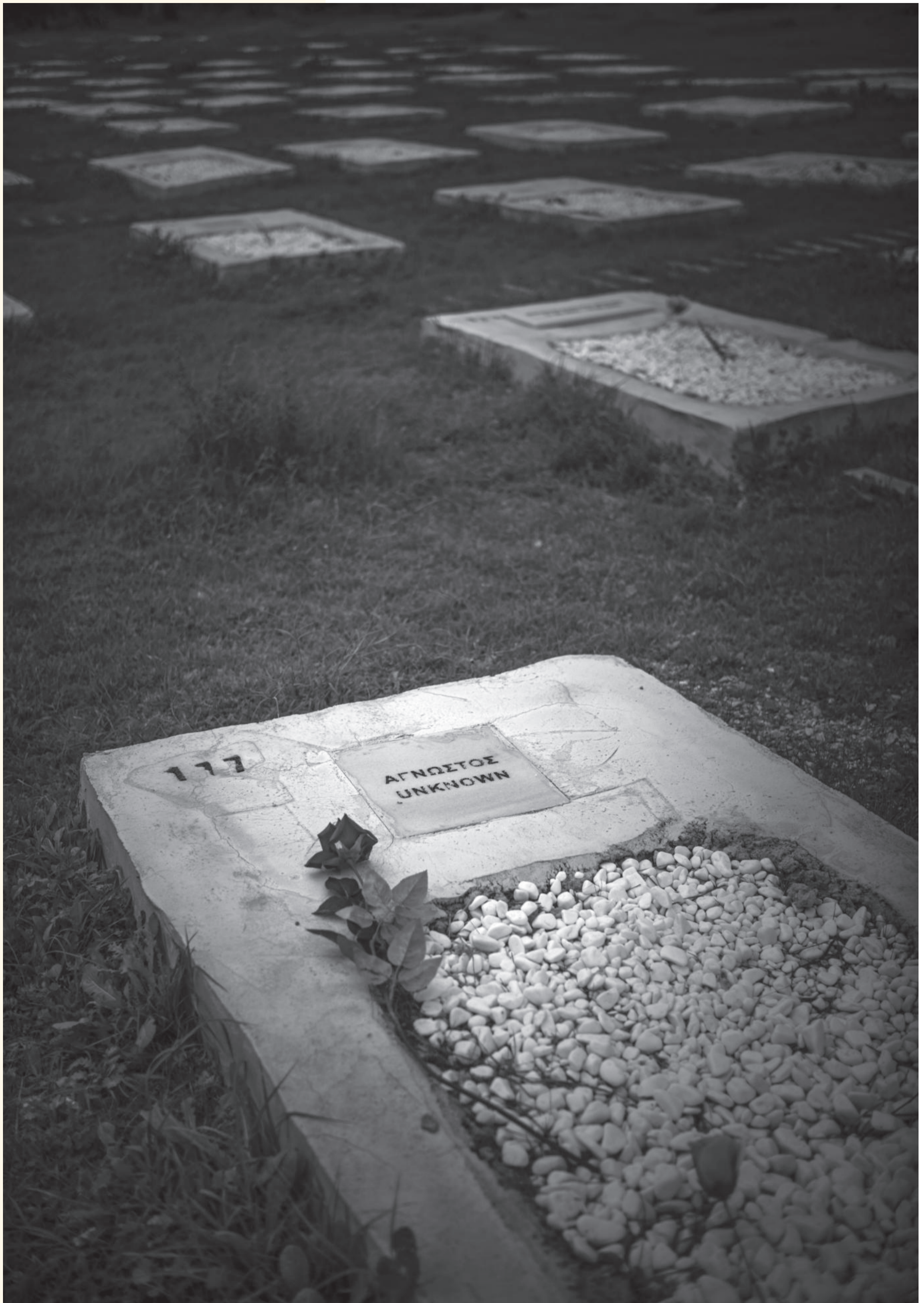
Friedhof für Geflüchtete in Kato Tritos, Lesbos, 2025: Hunderte Steinplatten markieren die meist namenlosen Gräber all jener, die aus dem Meer oder von den Stränden nur mehr tot geborgen wurden oder aber in den Lagern der Insel starben. Das Mittelmeer, die tödlichste Grenze der Welt, hat hier ein Mahnmal, das ständig weiter wächst.